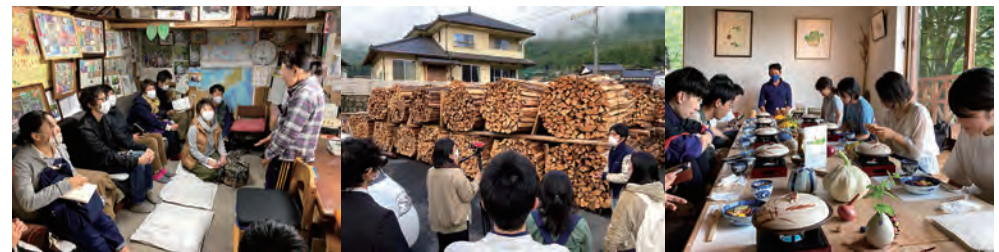
上勝町のいんどり農家さんへの訪問

1泊2日で滋賀県内外の 先進的な取り組みを訪問し、現場の実践者を講師にそのノウハウを学びます 。実践者から多くの刺激と知見を得る機会となります。また、 受講生同士のつながりを育む機会 でもあります。