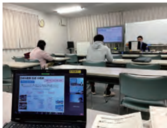
対面とオンラインのハイブリッド講義。

授業は金曜日16時30分～と土日に開講されます（日程はスケジュール参照）。 対面、オンラインのいずれでも受講可能 です。対面とオンラインを併用したハイブリッド型にも対応しています。欠席者はオンデマンドでの受講が可能です。90分間の講義では、学びを深めるために、受講生との議論や、受講生同士の意見交換の時間を設けています。現場講義では、現場で講師の生の声に学びます。成績はネットで提出するレポートで採点されます（コミュニティ・プロジェクトⅠ、Ⅱのプレゼンテーションを除く）。