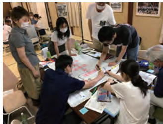
地域での実践的なフィールドワークへ参加も。

履修期間は、基本的に1年間での履修を想定していますが、各自の都合に合わせて、2年間での履修も選択可能です。カリキュラムは、前期5科目、後期5科目の必修科目、夏休み期間中の集中講義1科目の選択科目、計11科目14単位で構成されています。 社会人は必修の10科目12単位を取得し、検定試験に合格することで、称号「近江環人（コミュニティ・アーキテクト）」 が授与されます。大学院生の履修は「履修のてびき」を確認してください。