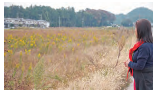
今回の開発の計画地の側には昔の開発による町の姿も。

込んできた。「計画地は安土を象徴するような場所。この開発への提案を通じて、安土全体のイメージアップとその後の地域の修景のケーススタディにできれば」。そうした思いで近江環人への入学に踏み切った。しかし、町田での住環境整備の経験が安土でも活かせると感じていた一方で、町田で築いてきた、専門領域を超えて一緒に都市計画や開発をしていくためのネットワークが滋賀にはなかった。近江環人に入った大きな理由は、都市計画におけるアドバイスをもらうことのできる先生の存在や、今後一緒に活動していける人脈づくりだった。