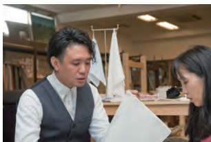
伝統産業をもっと身近にする試みにも挑戦中