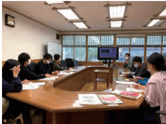
授業は、講義とディスカッションで構成。

学座は、年間10名を定員とした少数精鋭のプログラムで、社会人受講生と現役大学院生と一緒に受講する 大学院に設置された教育プログラム です。大学院生は各専攻の指定する単位数が認定され、社会人は科目等履修生としての受講となりますが、 取得した単位は、滋賀県立大学大学院に進学すれば各専攻で指定する単位数が認定される仕組み です。この制度を利用すれば最短1年で大学院を修了することも可能です。これまで11名が大学院に進学しています。