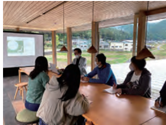
西栗倉村の現場講義。講師は近江環人の与語さん。

近江環人地域再生学座は、湖国近江をフィールドに、地域診断からまちづくり活動の実践まで、地域における多様な活動や挑戦のための知識・手法の教授を通じて、地域資源を活用した地域課題の解決や地域イノベーションを興し、 新しい地域社会を切り拓く、イノベーターやコーディネーター：「近江環人（コミュニティ・アーキテクト）」 を育成する講座です。2006年の開講から18年間で172名を超える人材を育成し、滋賀県内外で多くの近江環人が活躍しています。受講生は、民間企業、行政、NPO、自営業、大学院生など 多様な立場やスキルに、新たな知見や価値観を加え、スキルアップを図り、活動を進化 させていきます。