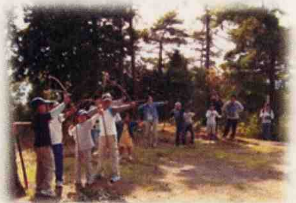
弓矢づくりと体験